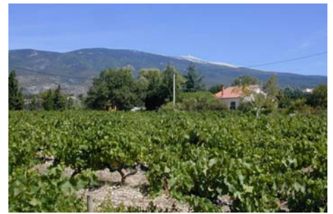
Blick von der Terrasse aus